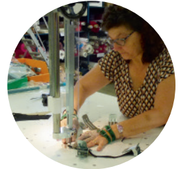
Et des artisanes couturières qui fabriquent avec minutie nos produits

CURIEUX(SE), INTRIGUÉ(E), CONVAINCU(E) ?